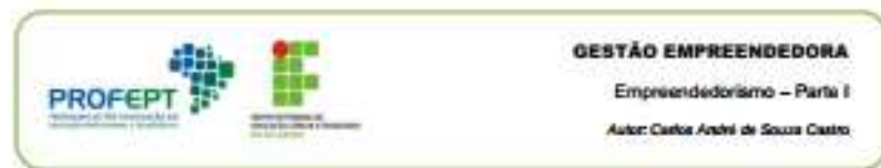
Figura 02 – Conteúdo (exemplo)