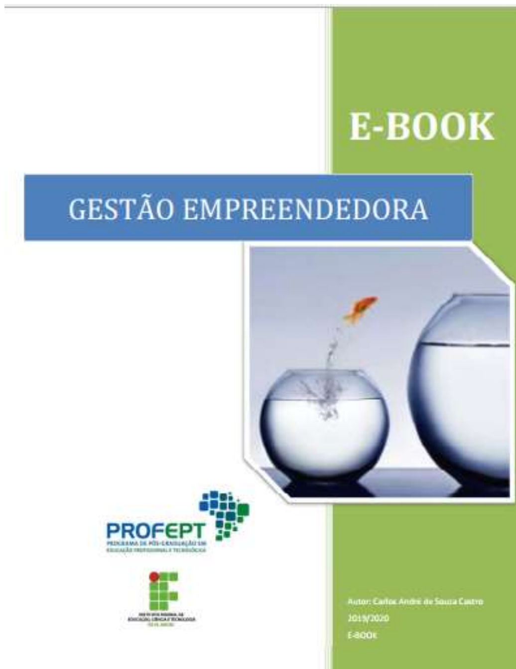
Figura 01 – Capa do E-book